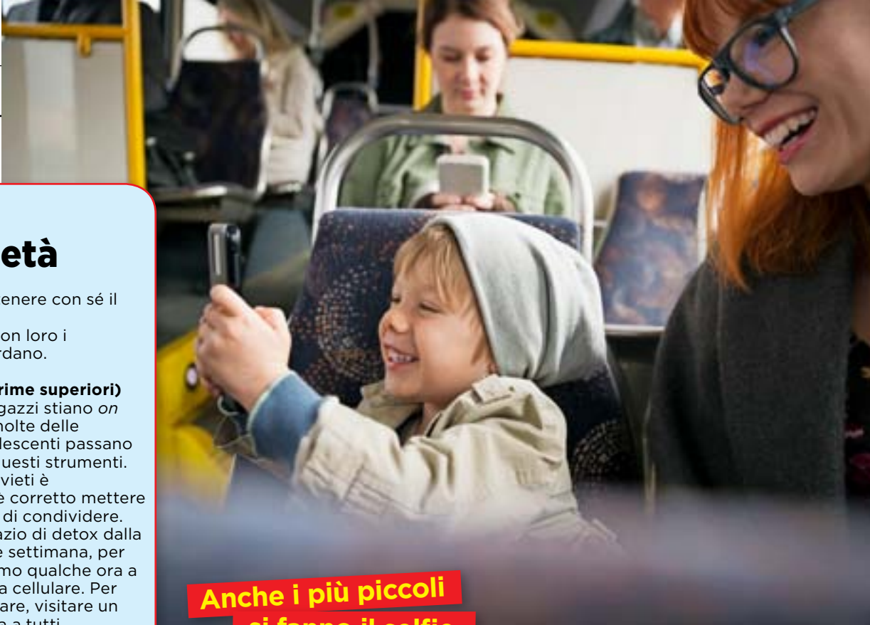
Anche i più piccoli si fanno il selfie