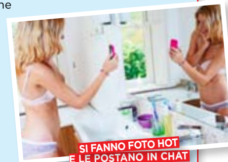
SI FANNO FOTO HOT E LE POSTANO IN CHAT