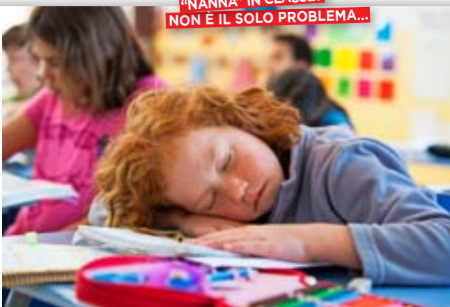
«NANNA» IN CLASSE? NON È IL SOLO PROBLEMA...

di emozioni intense. E circa il 10 per cento dei nostri ragazzi accusa problemi di insonnia dagli 11 anni in poi ». Di certo schermi luminosi e luci disturbano il sonno. Senza considerare che giocare o chattare a letto sollecitano il cervello e rendono più faticoso addormentarsi. «Il fatto è il nostro cervello di notte non riposa, ma lavora su funzioni preziose quali la memoria, la capacità di attenzione e quella di concentrazione e le interferenze con il ritmo sonno-